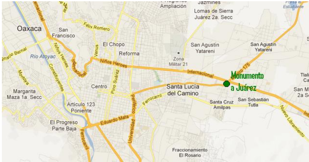
Indicaciones para llegar al Monumento a Juárez desde la ciudad de Oaxaca